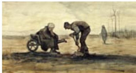
Vincent van Gogh, Onkruidverbranders, 1883, aquarel over potlood, collectie Caldic, Rotterdam

Hier eindigt de Vincent van Gogh wandeling. U hebt, voorzover dat nog mogelijk was, zijn voetstappen gevolgd door de oude buurten van de binnenstad van Den Haag. Als u nu het Panorama Mesdag betreedt, zult u daadwerkelijk een stap terug doen in de tijd en het oude Scheveningen precies zo zien, zoals Vincent het destijds zag.