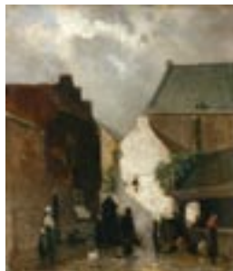
J.H. Weissenbruch, Vismarkt, 1873, collectie Gemeentemuseum Den Haag

U loopt langs dezelfde weg weer terug naar het Lange Voorhout .