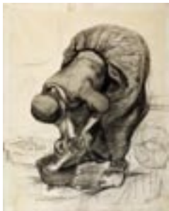
Vincent van Gogh, Pottenschurende vrouw, 1883/85, krijt op papier, 54,5 x 43,7, collectie Kröller-Müller Museum

“Ik moet vanmiddag nog naar de aardappelmarkt, maar daar te schilderen gaat niet vanwege het volk, ik heb er toch al dikwijls genoeg last van.” Vervolgens betreurt hij het dat hij niet gewoon in een huis aan de markt voor de ramen kan gaan zitten, om zo rustig te kunnen werken! En in brief 202: “Gij moet weten dat ik tegenwoordig 's morgens om 4 uur al buiten zit, omdat het op de dag te moeilijk is op straat te zitten, wegens de voorbijgangers en straatjongens.”