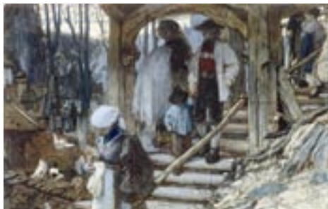
Matthijs Maris, Doopgang te Lausanne, 1862-1864, aquarel, collectie Gemeentemuseum Den Haag.