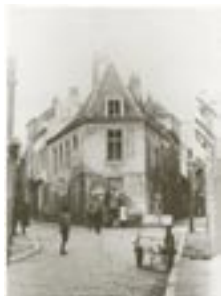
Juffrouw Idastraat, Den Haag, Eind 19e eeuw