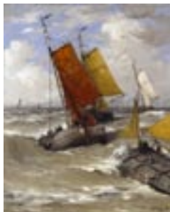
Hendrik Willem Mesdag, Het anker optrekken, 1895, Particuliere collectie