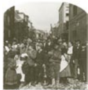
Volkstypen op het Slijkeinde, Den Haag, Eind 19e eeuw

U steekt het Scheveningse Veer over en loopt de Zeestraat (8) in. Aan uw rechterhand ziet u het gebouw van het Panorama Mesdag, een schilderij van 1680 vierkante meter in het rondom.