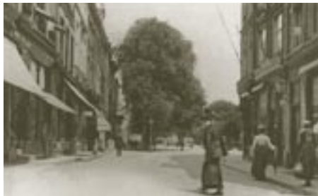
De Plaats, waar Vincent's 'oom Cent' de kunsthandel Goupil had, Den Haag, Eind 19e eeuw, collectie Gemeentearchief Den Haag