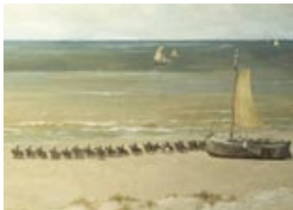
detail Panorama Mesdag, Den Haag, 1882, Detail 'Cavalerie in draf', geschilderd door George Hendrik Breitner.

Mesdag en zijn vrouw Sientje, Breitner, De Bock en Blommers schilderden het panorama in vier maanden tijd. Mesdag koos als onderwerp het uitzicht vanaf het Seinpostduin in Scheveningen, een plek die hij goed kende, want het was het hoogste duin van Scheveningen met een wijs uitzicht over het strand, Scheveningen badplaats, de zee, het oude dorpje Scheveningen en in de verte, aan de horizon, Den Haag. Met zijn Panorama legde Mesdag een stuk verdwijnend Oud-Scheveningen vast. De gemeente Den Haag was namelijk van plan om het Seinpostduin af te graven ten behoeve van de bouw van hotels en restaurants. Mesdag protesteerde krachtig, maar het mocht niet baten. Het leeuwendeel van het werk werd verricht door Mesdag zelf. Blommers beperkte zich tot het schilderen van een vissersvrouw met kinderen. De Bock werkte vooral aan het duinlandschap. Het moeilijkste deel, het oude dorp van Scheveningen met alle perspectivische problemen die moesten worden opgelost om een perfecte optische illusie te bereiken, lag in handen van Breitner. Ook schilderde hij een afdeling cavalerie in draf op het strand. Net als Vincent, kwam hij altijd geld tekort en kon hij een goed betaalde opdracht wel gebruiken. Vincent had grote bewondering voor het Panorama Mesdag en verzuchtte dat het enige gebrek van het schilderij was, dat het geen gebreken had!