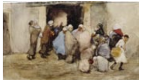
George Hendrik Breitner, Soepuitdeling, 1882, aquarel collectie Stedelijk Museum Amsterdam

U loopt vervolgens naar de Oude Molstraat (2) . In dergelijke straatjes vond Vincent de werkmansfiguren die hij graag portretteerde: voddensrapers, aardappelsjouwwers, een kolensjouwster, een vrouw aan een wastobbe en kolenladers. Op nrs. 23-27, aan uw rechterhand, bevond zich het voormalig Oude Mannenhuis. Een geliefd onderwerp voor Van Gogh waren ook de zogenaamde weesmannetjes of diaconiemannetjes, oudjes die hun laatste dagen sleten in instellingen voor de allerarmsten. Hier bevonden zich ook gaarkeukens en panden waar de soepuitdeling plaats vond. Onderwerpen die de succesvolle gevestigde leden van de Haagse School links lieten liggen. Breitner en Van Gogh hadden er het rijk alleen. Vincent schrijft aan Theo: “In het armste huisje, in het smerigste hoekje zie ik schilderijen of tekeningen en met onweerstaanbare drang gaat mijn geest die richting uit” (brief 218).