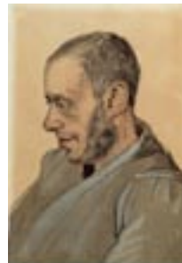
Vincent Van Gogh, Portret van de boekverkoper Jozef Blok, 1882, Potlood, pen, waterverf en lithografisch krijt op papier collectie Van Gogh Museum Amsterdam (aankoop 2005)