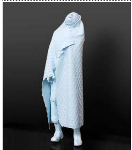
F. de Jong, The false prophet, 2004, silicone, rubber en polystyreen