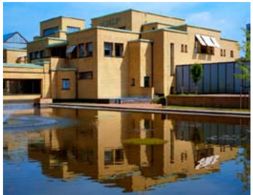
H.P. Berlage, Gemeentemuseum Den Haag, 1935