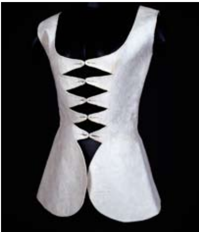
Jakje, ca. 1750 – 1800, katoen of linnen, point de Marseille, Foto: Marieke Koopmans