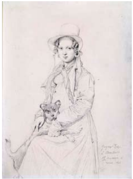
J.D. Ingres, Portret van Mlle. Thevin en haar hond, 1816, potloodtekening