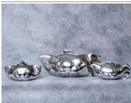
J. Steltman, Driedelig zilveren servies, 1925, zilver