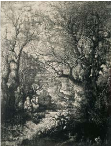
R. Bresdin, De vlucht naar Egypte, 1855, litho