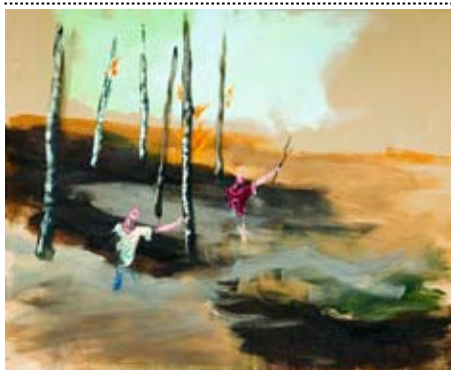
A. van Erp, Zonder titel, 2005, olieverf op doek