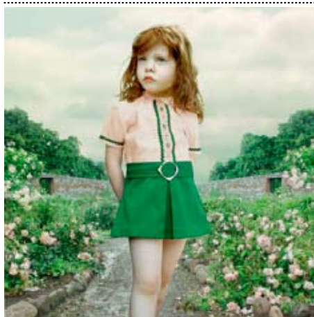
L. Lux, Rose garden, 2001, iffochrome