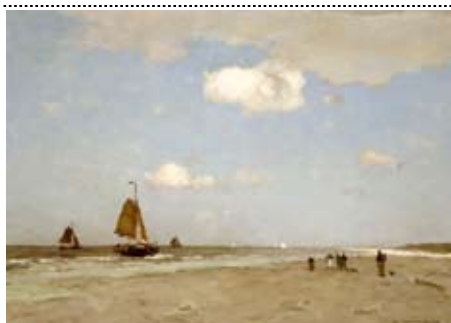
J.H. Weissenbruch, Strandgezicht, 1887, olieverf op doek