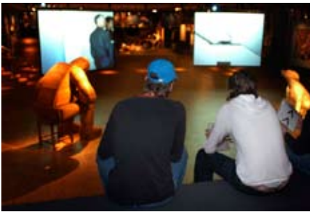
Wonderkamers in Gemeentemuseum, 'oneminutes'