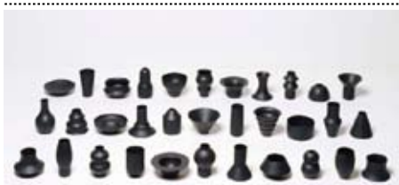
G. Laf, serie '99 variaties', 1993, steengoed; terra sigillata