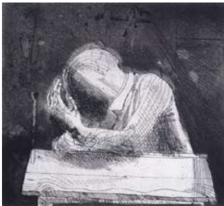
C. Westerik, Wanhopige man aan tafel, 1974, ets, aquatint en droge naald