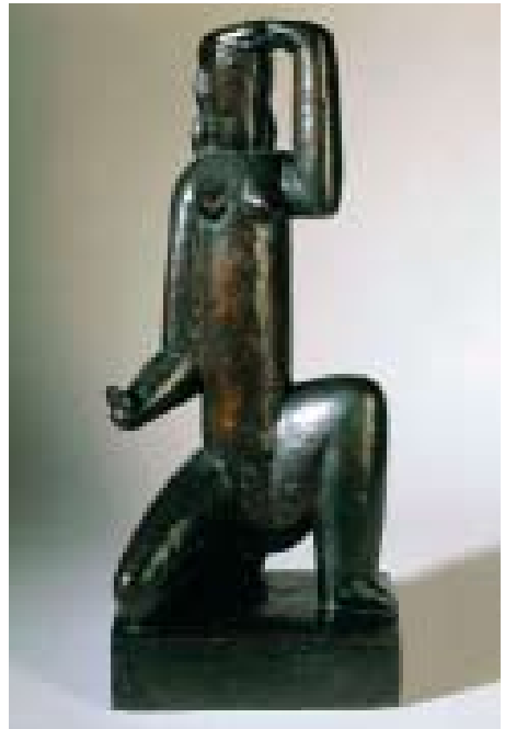
H. Lauwens, Vrouw met spiegel, 1929, brons