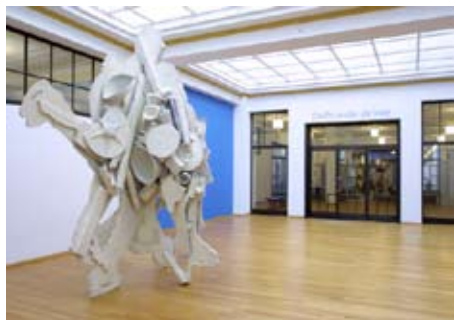
T. Cragg, Fast Particles, 1994, gemengde techniek