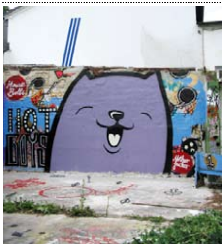
Wayne Horse, 2006