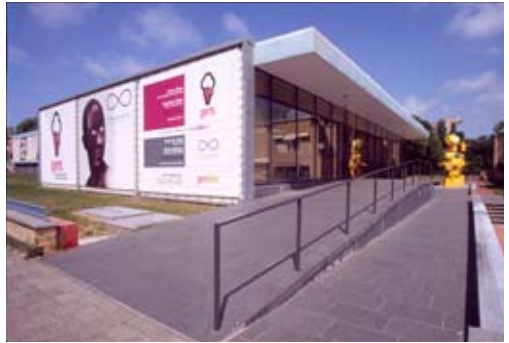
Schamhart-Heijligers, GEM, museum voor actuele kunst / Fotomuseum Den Haag, 1962, verbouwd in 2002 door architectenbureau Benthem-Crouwel.