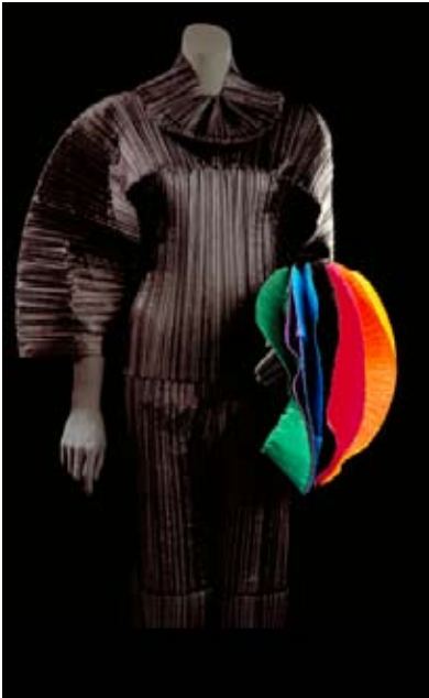
I. Miyake, Bamboo-Pleats / Flying Saucers, 1990 en 1994, polyester