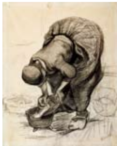
Vincent van Gogh, Pottenschurende vrouw, 1883/85, krijt op papier, 54,5 x 43,7, collectie Kröller-Müller Museum

“Ik moet vanmiddag nog naar de aardappelmarkt, maar daar te schilderen gaat niet vanwege het volk, ik heb er toch al dikwijls genoeg last van.” Vervolgens betreurt hij het dat hij niet gewoon in een huis aan de markt voor de ramen kan gaan zitten, om zo rustig te kunnen werken! En in brief 202: “Gij moet weten dat ik tegenwoordig 's morgens om 4 uur al buiten zit, omdat het op de dag te moeilijk is op straat te zitten, wegens de voorbijgangers en straatjongens.”