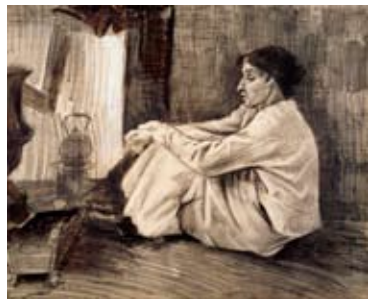
Vincent van Gogh, Sien met sigaar in de hand, 1882, potlood, wit krijt en inkt, collectie Museum Kröller-Müller Otterloo