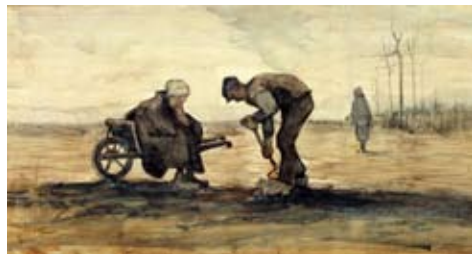
Vincent van Gogh, Onkruidverbranders, 1883, aquarel over potlood, collectie Caldic, Rotterdam

Hier eindigt de Vincent van Gogh wandeling. U hebt, voorzover dat nog mogelijk was, zijn voetstappen gevolgd door de oude buurten van de binnenstad van Den Haag. Als u nu het Panorama Mesdag betreedt, zult u daadwerkelijk een stap terug doen in de tijd en het oude Scheveningen precies zo zien, zoals Vincent het destijds zag.