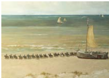
detail Panorama Mesdag, Den Haag, 1882, Detail 'Cavalerie in draf', geschilderd door George Hendrik Breitner.

Mesdag en zijn vrouw Sientje, Breitner, De Bock en Blommers schilderden het panorama in vier maanden tijd. Mesdag koos als onderwerp het uitzicht vanaf het Seinpostduin in Scheveningen, een plek die hij goed kende, want het was het hoogste duin van Scheveningen met een wijs uitzicht over het strand, Scheveningen badplaats, de zee, het oude dorpje Scheveningen en in de verte, aan de horizon, Den Haag. Met zijn Panorama legde Mesdag een stuk verdwijnend Oud-Scheveningen vast. De gemeente Den Haag was namelijk van plan om het Seinpostduin af te graven ten behoeve van de bouw van hotels en restaurants. Mesdag protesteerde krachtig, maar het mocht niet baten. Het leeuwendeel van het werk werd verricht door Mesdag zelf. Blommers beperkte zich tot het schilderen van een vissersvrouw met kinderen. De Bock werkte vooral aan het duinlandschap. Het moeilijkste deel, het oude dorp van Scheveningen met alle perspectivische problemen die moesten worden opgelost om een perfecte optische illusie te bereiken, lag in handen van Breitner. Ook schilderde hij een afdeling cavalerie in draf op het strand. Net als Vincent, kwam hij altijd geld tekort en kon hij een goed betaalde opdracht wel gebruiken. Vincent had grote bewondering voor het Panorama Mesdag en verzuchtte dat het enige gebrek van het schilderij was, dat het geen gebreken had!