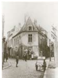
Juffrouw Idastraat, Den Haag, Eind 19e eeuw