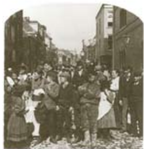
Volkstypen op het Slijkeinde, Den Haag, Eind 19e eeuw

U steekt het Scheveningse Veer over en loopt de Zeestraat (8) in. Aan uw rechterhand ziet u het gebouw van het Panorama Mesdag, een schilderij van 1680 vierkante meter in het rondom.