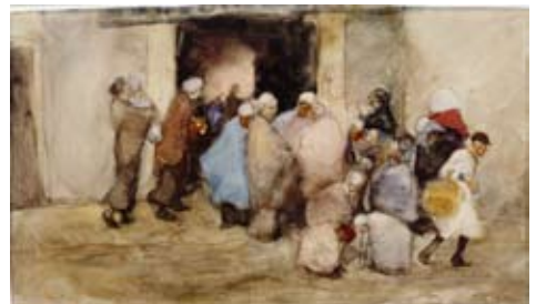
George Hendrik Breitner, Soepuitdeling, 1882, aquarel collectie Stedelijk Museum Amsterdam

U loopt vervolgens naar de Oude Molstraat (2) . In dergelijke straatjes vond Vincent de werkmansfiguren die hij graag portretteerde: voddensrapers, aardappelsjouwwers, een kolensjouwster, een vrouw aan een wastobbe en kolenladers. Op nrs. 23-27, aan uw rechterhand, bevond zich het voormalig Oude Mannenhuis. Een geliefd onderwerp voor Van Gogh waren ook de zogenaamde weesmannetjes of diaconiemannetjes, oudjes die hun laatste dagen sleten in instellingen voor de allerarmsten. Hier bevonden zich ook gaarkeukens en panden waar de soepuitdeling plaats vond. Onderwerpen die de succesvolle gevestigde leden van de Haagse School links lieten liggen. Breitner en Van Gogh hadden er het rijk alleen. Vincent schrijft aan Theo: “In het armste huisje, in het smerigste hoekje zie ik schilderijen of tekeningen en met onweerstaanbare drang gaat mijn geest die richting uit” (brief 218).