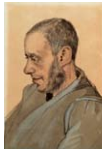
Vincent Van Gogh, Portret van de boekverkoper Jozef Blok, 1882, Potlood, pen, waterverf en lithografisch krijt op papier collectie Van Gogh Museum Amsterdam (aankoop 2005)