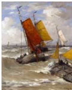
Hendrik Willem Mesdag, Het anker optrekken, 1895, Particuliere collectie