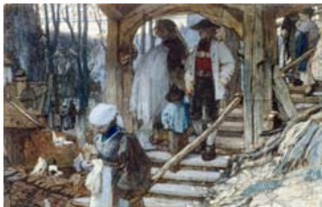
Matthijs Maris, Doopgang te Lausanne, 1862-1864, aquarel, collectie Gemeentemuseum Den Haag.