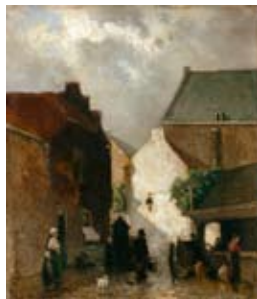
J.H. Weissenbruch, Vismarkt, 1873, collectie Gemeentemuseum Den Haag

U loopt langs dezelfde weg weer terug naar het Lange Voorhout .